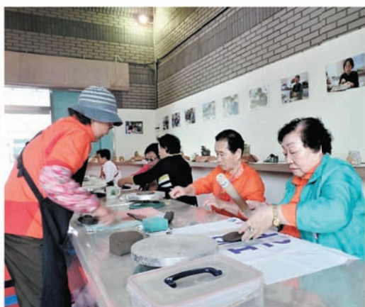
재가어르신 도자문화 및 황포돛배 체험 (5.8 / 5.11)