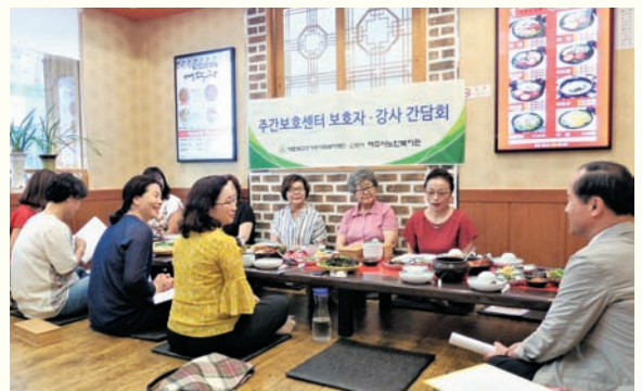
주간보호센터 보호자·강사 간담회(6/27) 항아리보쌈