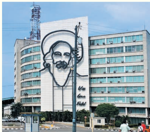
〈사진1. 빌딩 벽의 체 게바라〉

지난 호에 이어 이번에는 카리브 해의 진주 쿠바와 잉카 문명의 상징인 페루를 중심으로, 푸에르토리코, 볼리비아에서 보고 느낀 바를 서술하려고 한다. 쿠바 : 쿠바는 공산 국가로 우리와 수교는 없으나 관광 여행에는 지장이 없다. 멕시코 동쪽 대서양의 카리브 해의 섬나라로 한반도의 반 정도 크기에 인구는 남한의 4분의 1 정도로 보면 된다. 우리나라는 쿠바의 수도 아바나에 무역진흥 공사 쿠바 지사를 두고 있으며 영사 업무도 한다. 현재의 쿠바는 1959년 피델 카스트로가 중남미 공산 혁명을 이루려다 볼리비아에서 사망한 체 게바라와 함께 혁명을 일으켜 성공한 중남미 유일의 공산 국가이다.