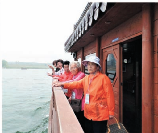
재가어르신 도자문화 및 황포돛배 체험 (5.8 / 5.11)