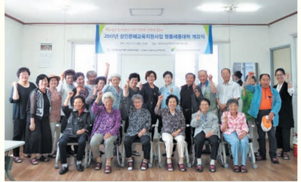
성인문해교육지원사업 명품세종대학 개강식(6/5) 복지관