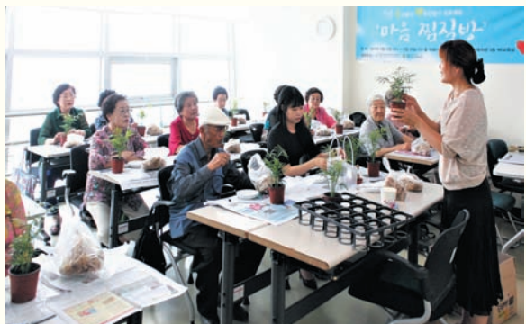
동네방네 행복만들기 프로젝트 ‘마음찜질방’ (5.31~6.28)