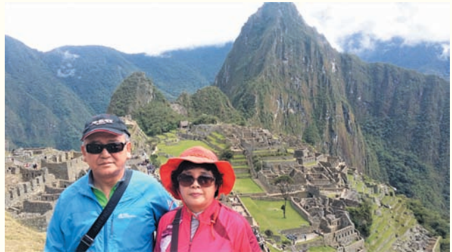
〈사진2. 마추픽추 잉카 제국 모습〉

다음은 푸에르토리코와 볼리비아 : 푸에르토리코는 미국의 자치령으로 천혜의 관광 자원이 있는데도 정치 지도자들이 부패해 국가 부도 사태로 미국의 한 주로 편입되기를 희망하나 부채를 떠안기 싫은 미국 의회의 거부로 미국 국민 대우는 받으나 하나의 주로 편입되진 않았으며 우리나라의 선경을 비롯한 기업들이 값싼 인건비를 이용해 진출해 있다. 다음은 세계 두 번째로 많은 천연 가스 매장량을 가지고도 가난한 나라 볼리비아에서는 지금 우리나라에서 보기 힘든 티코가 새 차처럼 깨끗한 상태로 상당히 많이 달리고 있어 인상적이었다. 그 동안 문이 두 짝인 독일의 폭스바겐이 주종이었는데 문이 네 개나 되는 우리 티코는 폭발적인 인기였다고 한다. 86~7년 경엔가 대우의 김우중 회장이 아르헨티나 지사를 개설 하고 남미를 공략한다고 자랑하던 모습이 새삼 떠올랐다. 다음은 잉카문명의발상지 페루 : 멕시코 이하 모든 중남미 국가들의 공통점이 스페인의 콜럼버스가 신대륙을 발견하여 점령한 후 300여 년을 식민 통치함으로써 지금도 스페인어가 모든 중남미 국가들의 공용어이고 마약 조직이 국가 경제와 공권력에 지대한 영향력을 주고 있다는 사실이다.