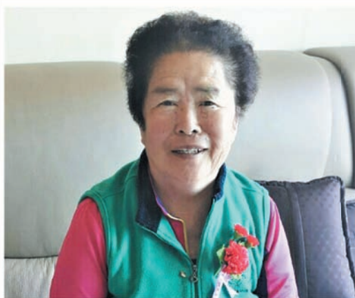
어버이날 행사 (5.8)