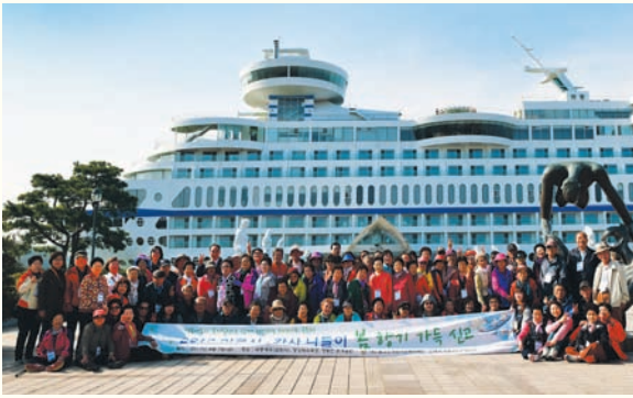
2017년 어르신 · 강사 나들이 ‘봄 향기 가득 싣고’ (4/7) 강원 동해(무릉계곡, 삼화사) 외