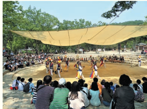
노인문화예술지원사업 '신바람 난 청춘' - 한국민속촌 (4.12. 수)