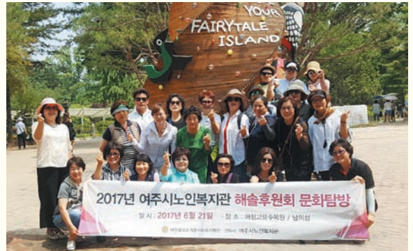
해솔후원회 문화탐방(6/21) 아침고요 수목원, 남이섬