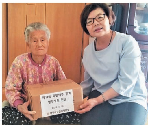
제11회 희망여주 걷기대회 영양식품키트 전달 (6.12)