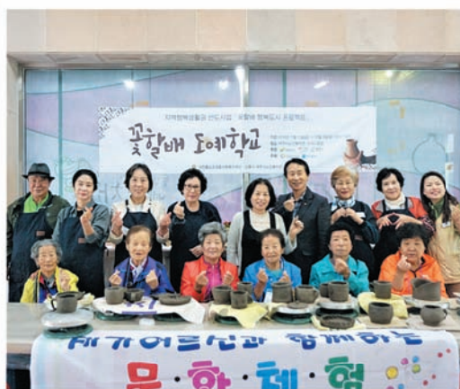
재가어르신 도자문화 및 황포돛배 체험 (5.8 / 5.11)