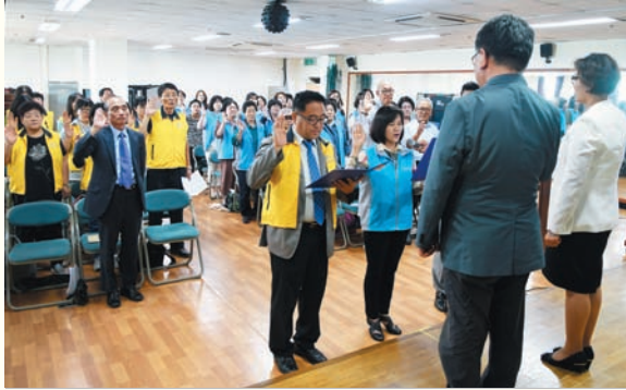
사회공헌활동 기부은행 자원봉사자 기초교육 및 발대식 (6/2) 복지관