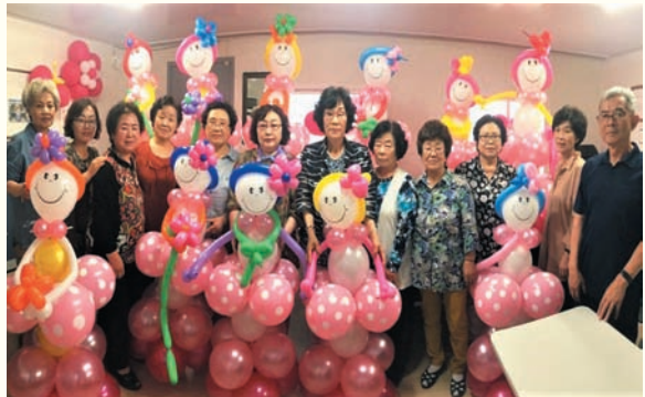
여울봉사단 별풍선 동아리 활동교육 (4.17~6.26)