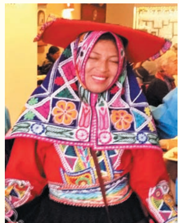
〈사진3. 알파카 털로 짠 잉카 전통의상〉

다만 특이 한 것은 그들에게는 문자가 없었으며 입으로 전달되는 구전과 매듭의 색깔과 꼬임새로 표현했다고 한다. 안데스 산맥의 명물인 알파카는 해발 4,200~4,800m 고산 지대에 사는 낙타과의 동물이며 우리나라의 송아지 크기만 하다. 그 털로 짠 잉카의 전통 의상은 화려했으며 국내에서 100만원 이상 하는 것을 3분의 1 가격이면 살 수 있었다.