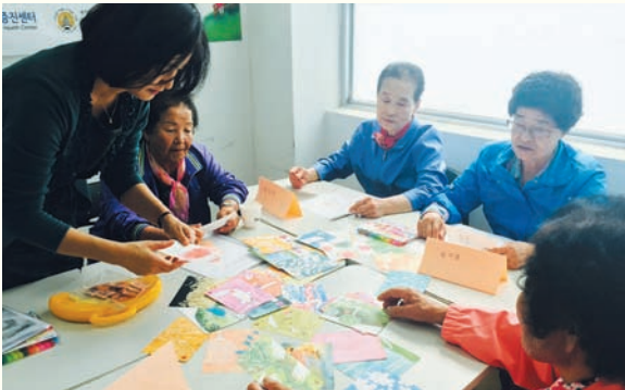
노인우울집단프로그램 ‘어르신 행복만들기’ (4/12~5/19)