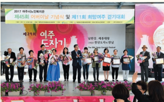
제45회 어버이날 기념식 및 제11회 희망여주걷기대회 (5/14) 여주도자세상 야외무대