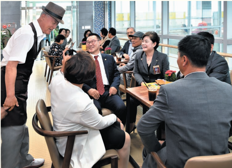
사진설명 : 바리스타 교육장 설치 및 자재 기증식 (5. 29. 월)