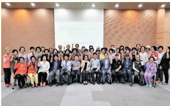
지역행복생활권 선도사업 꽃할배 행복도시 프로젝트 합동워크숍(6/22) 좋은아침 연수원