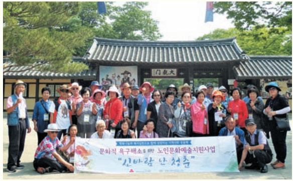
문화적 욕구해소를 위한 노인문화예술지원사업 ‘신바람 난 청춘’ (4/12) 한국민속촌, 국립극장