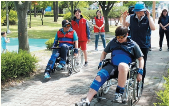
상반기 직원연수(6/10) 복지관 및 근린공원