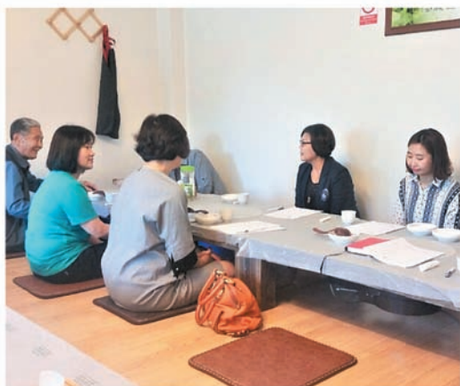
자원봉사자 간담회 (6.5)