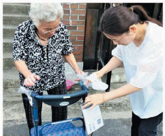
인천국제공항공사 '실버카 11명 지원' (9.15)