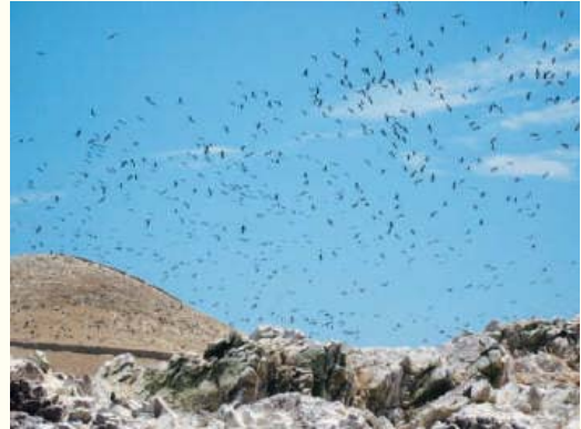
〈사진 1. 칠레 해안의 새똥 섬〉