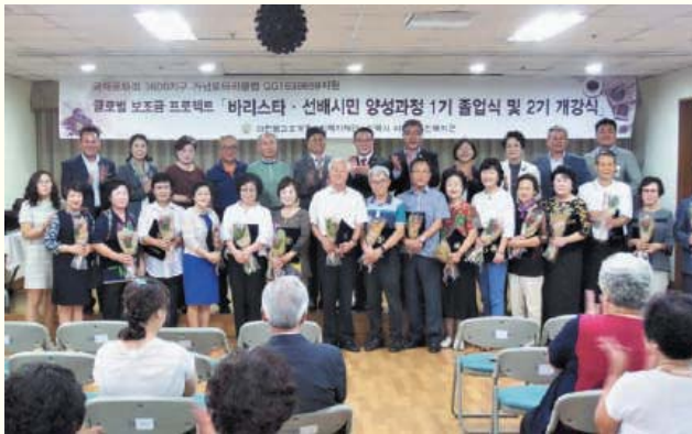
바리스타 양성과정 1기 졸업식 및 2기 입학식(8.27)