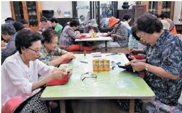
여성생활사박물관 견학 및 체험 활동(7/5) 여성생활사박물관(여주시 강천면)