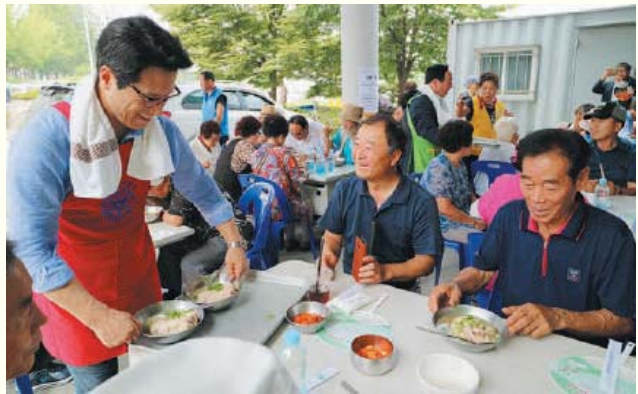
어르신 건강챙기기 프로젝트 II 삼계탕으로 건강한 여름나기(7.12)