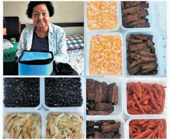
신세계푸드 사랑의 도시락 매주 수요일