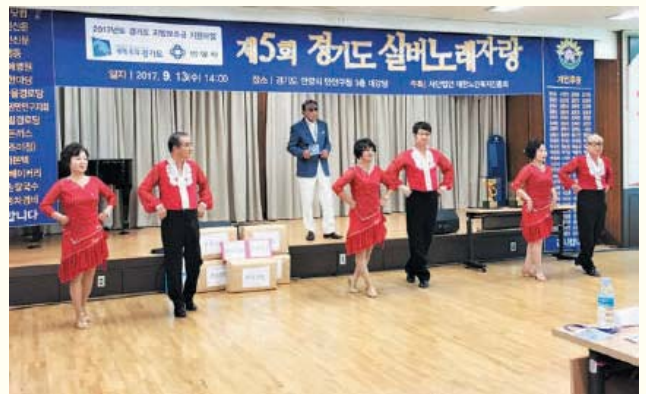
제5회 경기도 실버노래자랑 참여(9.13) 안양시 만안구청