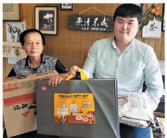
한강통합물관리지원센터 추석명절선물 (9.28)