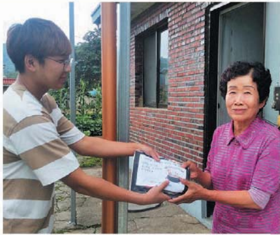
삼계탕 나눔행사 (7.12)