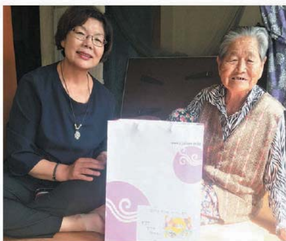
경기사회복지협회 추석명절선물 (9.25)