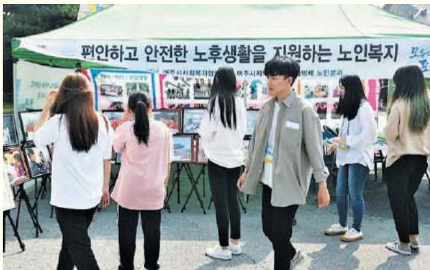
제8회 사회복지의 날 기념식 및 복지박람회 참여(9.7) 신륵사관광지 야외공연장