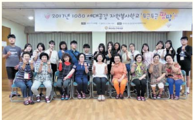
1080 세대공감 자원봉사학교 '두근두근 팡팡' (7.24~7.26)