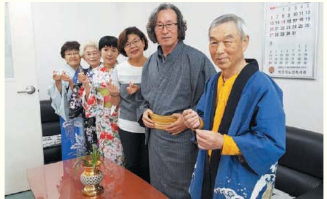
사회교육 일본어 수업 기모노 체험(8.29)