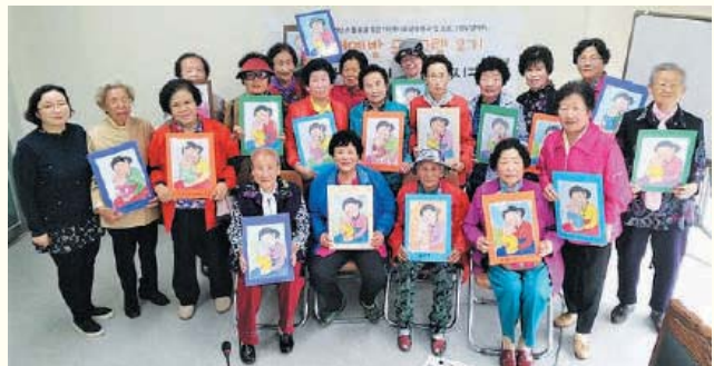
우울 및 치매예방을 위한 전문프로그램 '소중한 나의 기억 지키기'