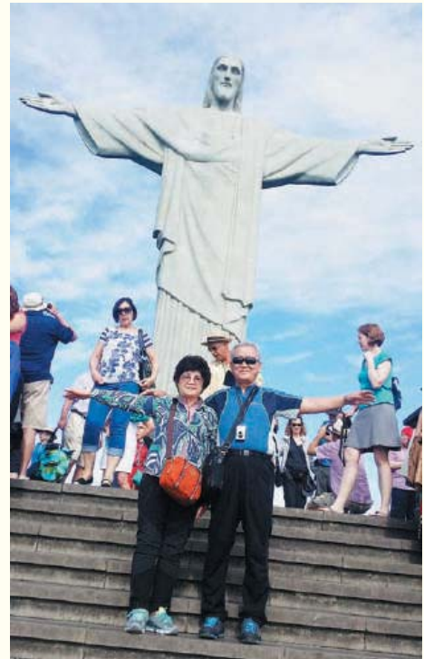
〈사진2. 세계 최대 예수상〉

비용도 많이 들고 기간도 긴 여행이었지만 보람 있는 여행이었다. 3회에 걸친 중남미 여행기를 관심 있게 읽어주신 여러분께 감사드린다.