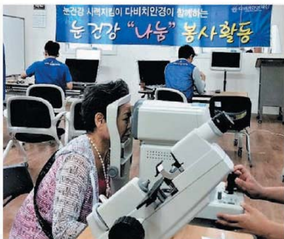
다비치 안경원 '눈 건강 나눔봉사' (8.10)