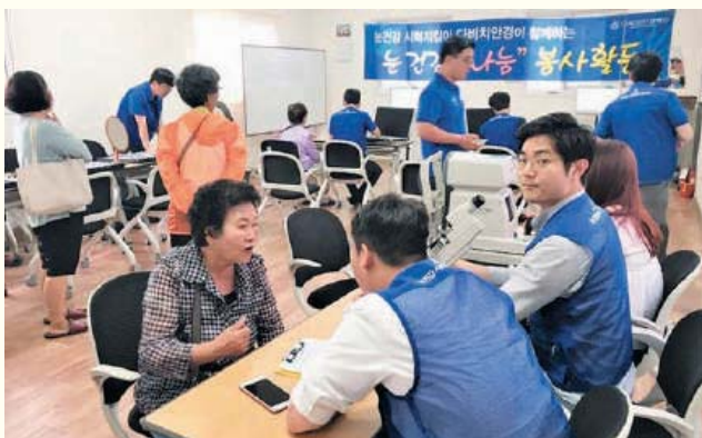
'다비치안경' 과 함께하는 시력검진 및 안경지원 (8/10)