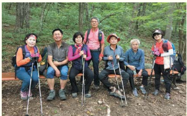
등산동호회 태기산 등반(8.13) 황성군 둔내면