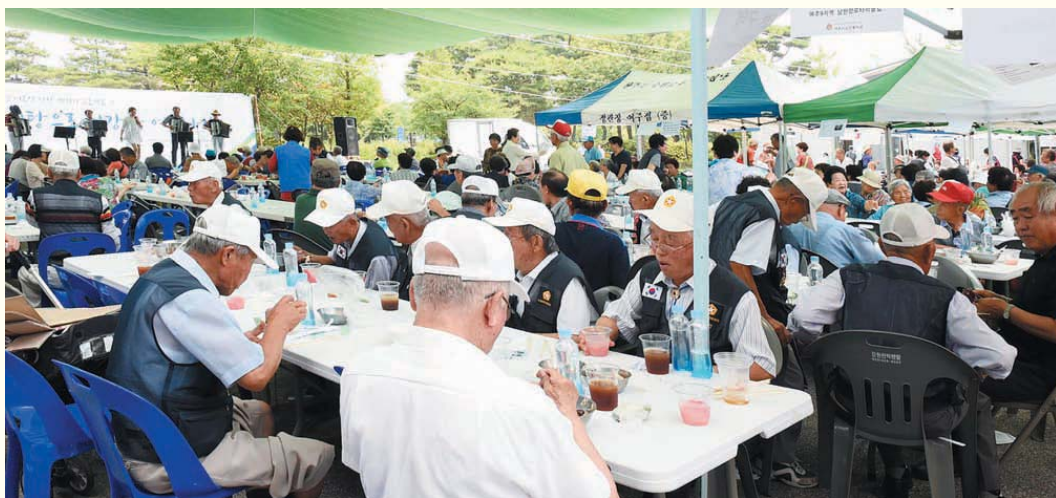
사진설명 : 어르신 건강챙기기 프로젝트 II 「삼계탕으로 건강한 여름나기」 (7.12.수)