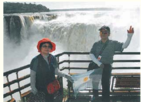
〈사진3. 일명 악마의 목구멍, 아르헨티나에서 본 이과수폭포〉