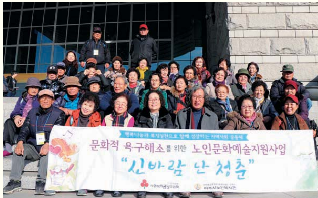
문화적 욕구해소를 위한 노인문화예술지원사업 '신바람 난 청춘' (11/29) 전쟁기념관 외