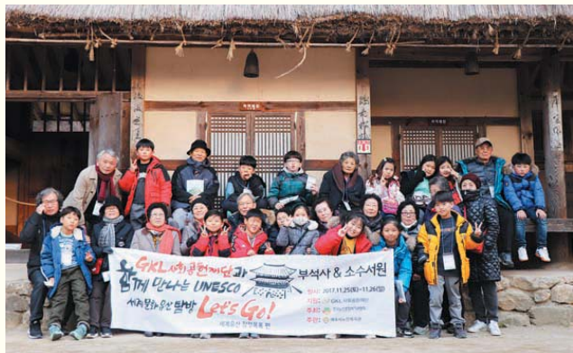
GKL사회공헌재단과 함께 만나는 UNESCO 세계문화유산탐방 Let's Go! 세계문화유산잠정목록편 (11/25~11/26) 부석사 · 소수서원