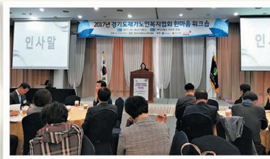
경기도재가노인복지협회 한마음워크숍 참여 (10/19~20) 안성 레이크힐스리조트