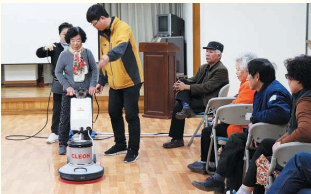
노인단기 직무특강 -건물위생관리사 교육과정 (11/2~11/16) 복지관 2층 강당