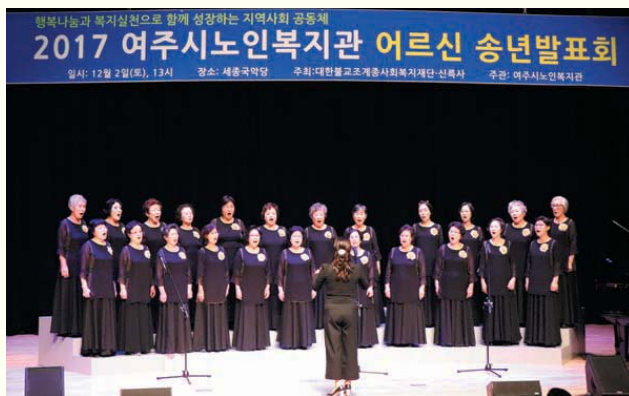
2017 어르신 송년발표회(12/2) 세종국악당