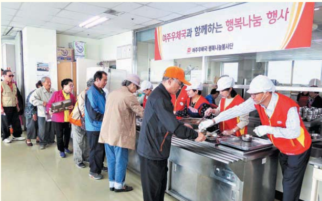
여주우체국 후원금 전달 및 배식봉사(10/16)