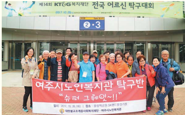
제14회 KT&G복지재단 전국 어르신 탁구대회 참여 (10/26) SK핸드볼경기장