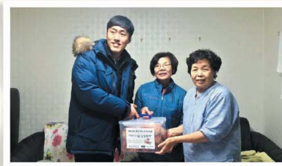
자비나눔김장축제 김치 전달 (11/24)