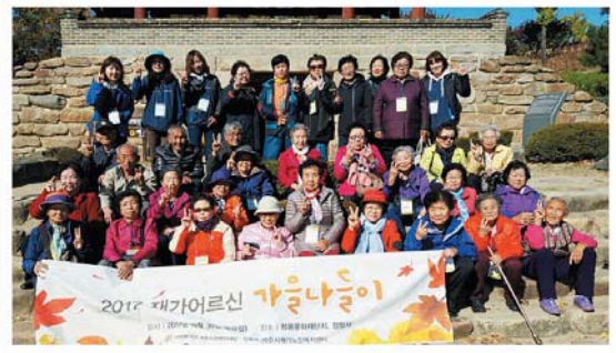
어르신 가을나들이 (10/30) 청풍문화재단지