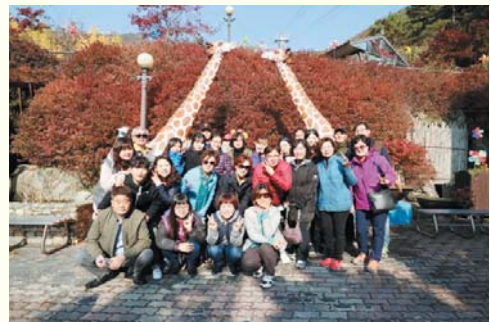
하반기 직원연수(11.3~4) 전라북도 완주군 대둔산

표지 : GKL 사회공헌재단과 함께 만나는 UNESCO 세계문화유산탐방