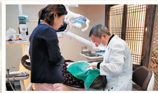
어르신 치과진료 지원 (12/5) 백세치과