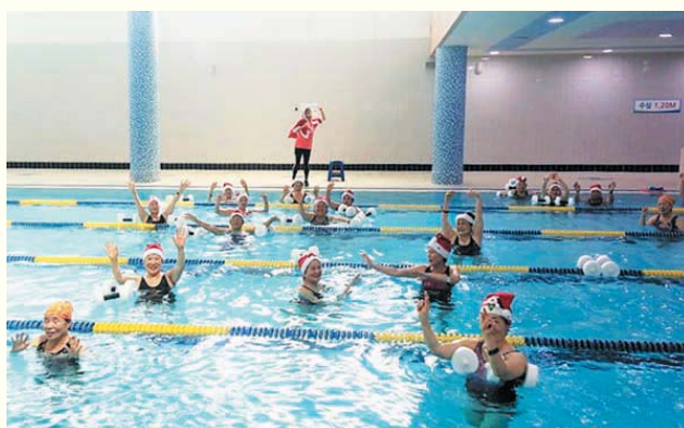
실내수영장 성탄행사 '물 만난 산타' (12/22)