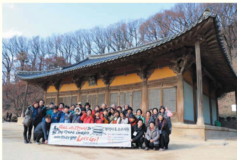
사진설명 : GKL 사회공헌재단과 함께 만나는 UNESCO 세계문화유산탐방 (11.25~11.26)