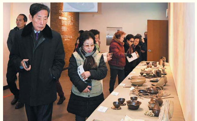
여주, 이천, 광주 합동 도자전시회(12/21~28) 남한산성아트홀