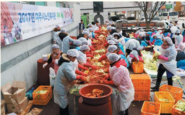
자비나눔 김장축제 (11/23~11/24) 복지관 주차장