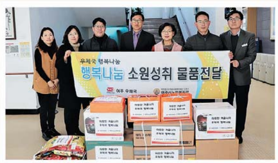
여주우체국 행복나눔 소원물품전달 (12/11)