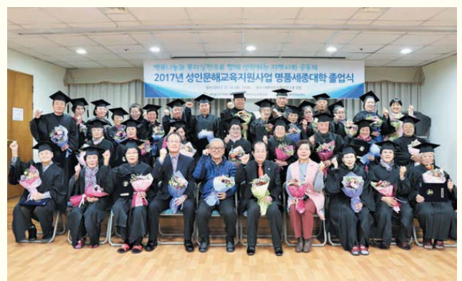
성인문해교육지원사업 명품세종대학 졸업식(12/22)