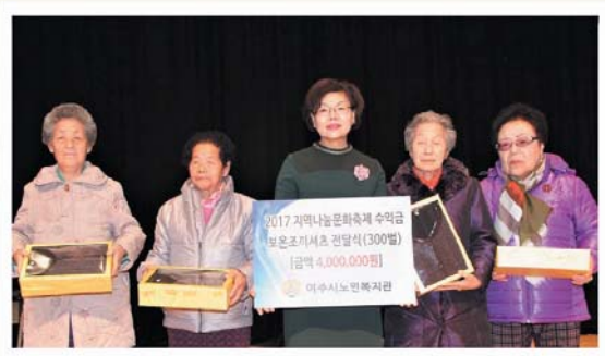
지역나눔문화축제 수익금 조끼 · 셔츠전달 (12/2) 세종국악당