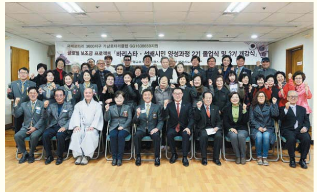
바리스타 2기 졸업식 및 3기 개강식(11/30)