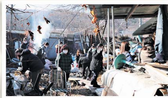
주거환경개선 (12/9) 산북면 주여리