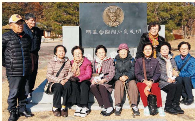
세종인문동아리 명성황후 기념관 문화탐방(11/16)