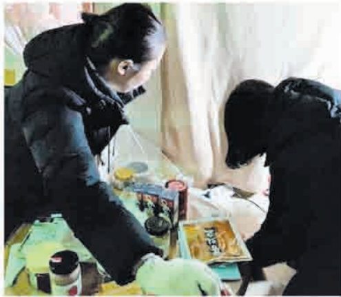
청소년자원봉사단 재가어르신 집 청소(1/4.목)