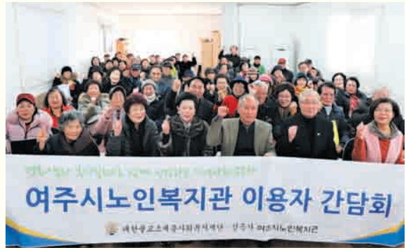
복지관 이용자 간담회 (1/25)