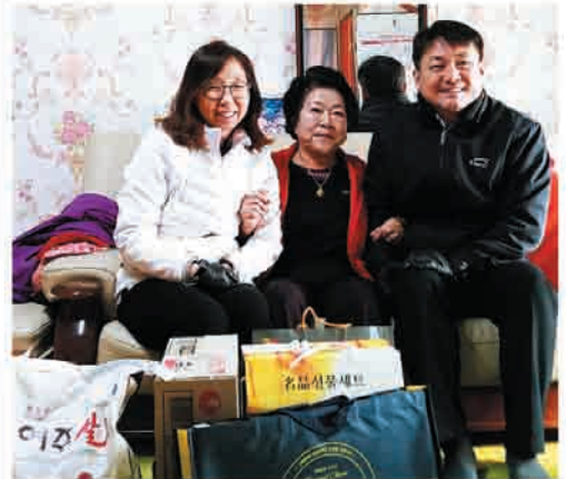
수자원공사 설명절 선물 전달(2/8.목)