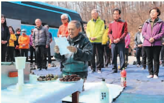
여주시노인복지관 산악회 등반 및 시산제(3/11) 진천 농다리 및 두타산