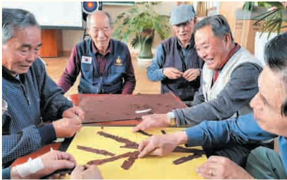
경로당활성화사업 미술프로그램 'Good 메모리2' (3/6~6/12) 능서면 내양3리 경로당