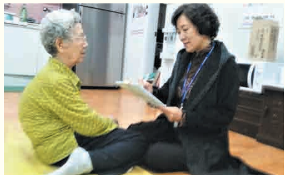
여주시 독거노인 현황조사 (3/5~4/6)