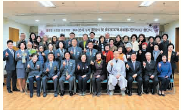
글로벌 보조금 프로젝트 '바리스타 3기 졸업식 및 로타리지역사회봉사단(RCC) 창단식 (3/9)