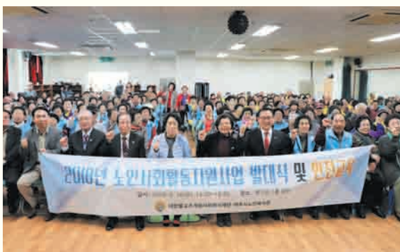
2018년 노인사회활동지원사업 · 재능나눔 발대식 및 안전교육(3/16)