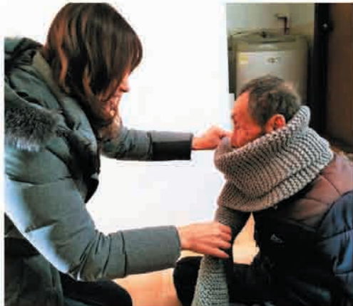
청소년 문화의 집 후원 목도리 전달(2/1.목)