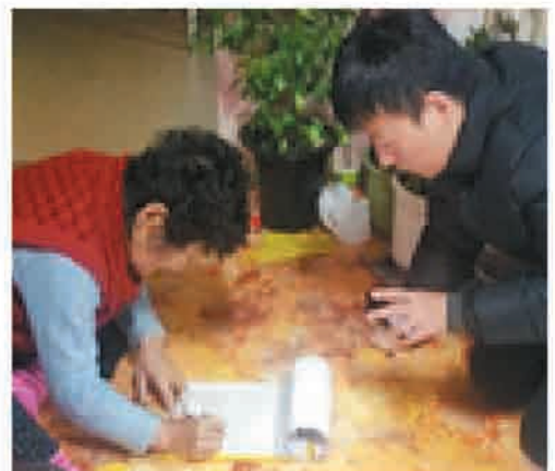
재가어르신 만족도 및 욕구조사(3/5~3/25)