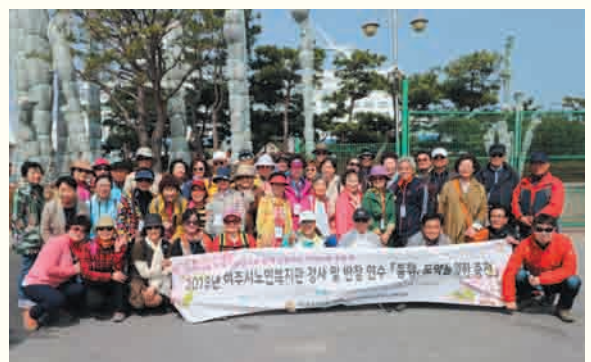
프로그램 강사 및 반장 연수 '동행, 도약을 위한 충전' (3/31) 강릉