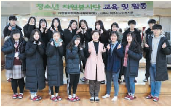
청소년 자원봉사자 학교 (1/3~1/5)