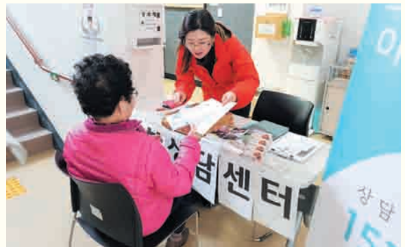
노인학대상담-경기남부노인보호전문기관 연계 (3/13)