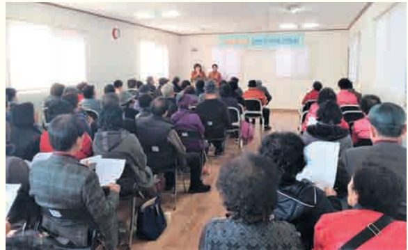
여울봉사단 전체 간담회 (2/23)