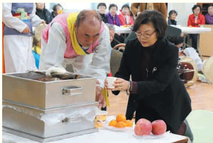
사진설명 : 정월대보름맞이 지신밟기 (2.27)