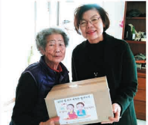
재가어르신 설 명절 선물전달(2/12.월)