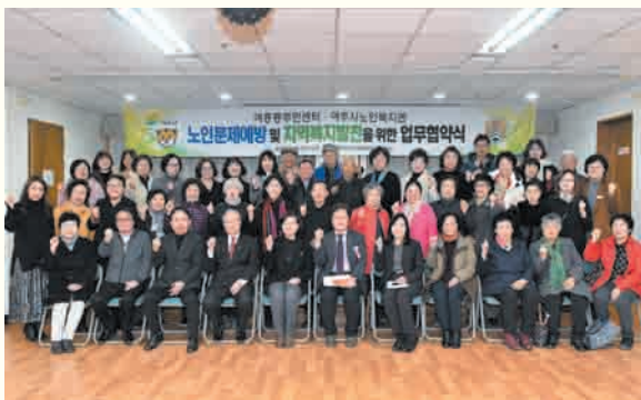
여주시노인복지관 · 여흥동주민센터 업무협약식 (2/28)