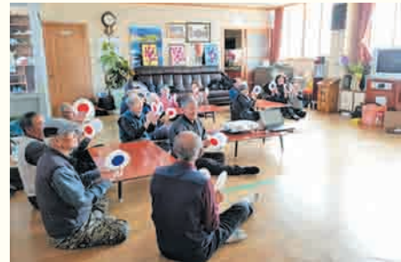
치매예방을 위한 미술프로그램 'Good메모리2'