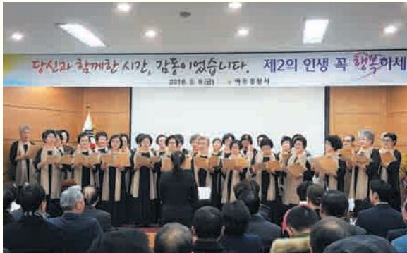
행복시니어합창단 여주경찰서장 퇴임식 공연 (2/9)