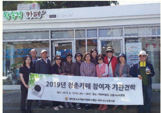
청춘카페 참여자 기관견학(6. 12)