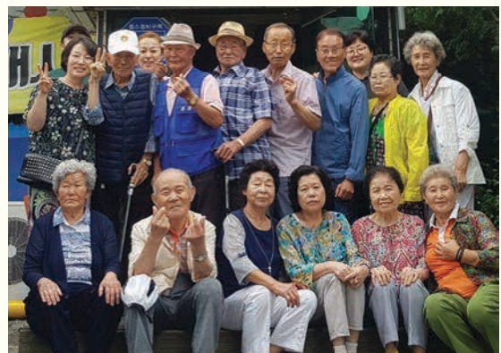
인지지원 외부활동(6. 26)