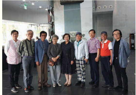
실버기자단 간담회(5. 14)