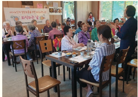
재가어르신 외식지원 ‘외식하는 날’ (5/29)