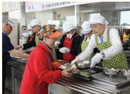
어버이날 기념행사(5. 8)