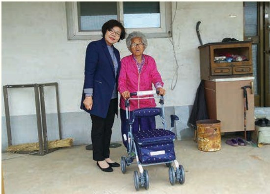
인천국제공항공사 실버카지원 (5/28)