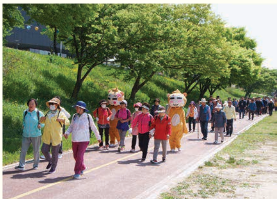
희망여주 걷기대회(5. 3)