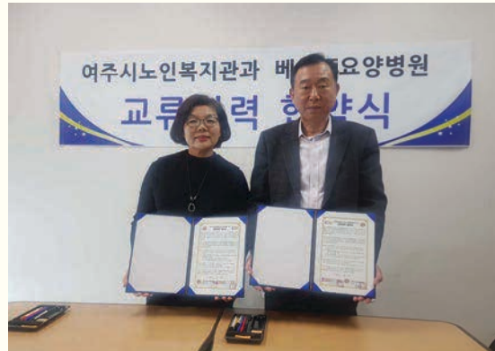
교류협력 협약 체결(4. 10)