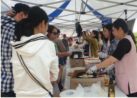
후원캠페인 ‘이천원의 행복’ (5/12)