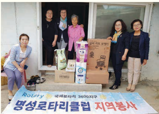
명성로타리클럽 후원물품전달 (5/30)