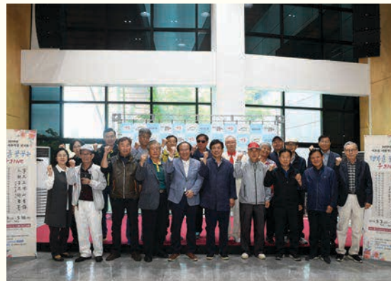
어르신 서화작품 전시회(5. 3 ~ 5. 16)