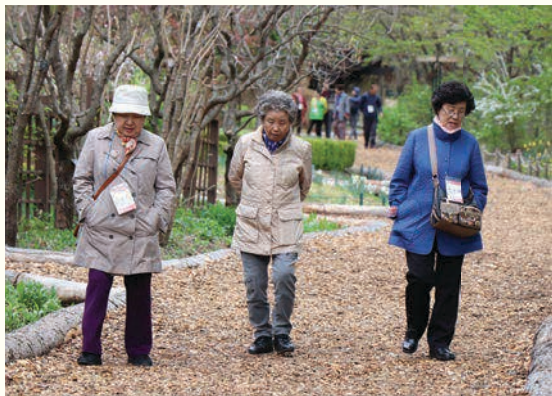
노인사회활동지원사업 봄나들이(4. 26)