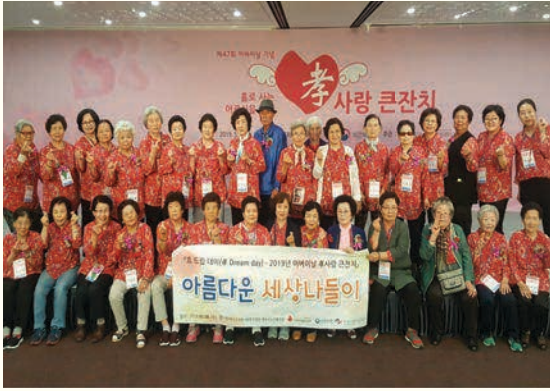
아름다운 세상나들이(5. 8)