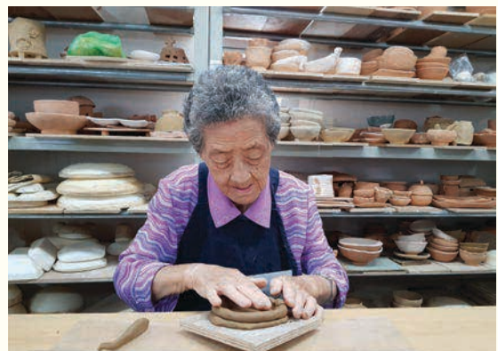
재가어르신 여가 프로그램 ‘오 해피데이’ (6/27)