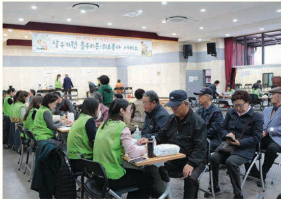
장수기원 블루리본.의료봉사(3. 24)