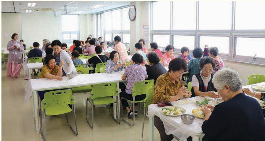
2019년 추석맞이 한가위 한마당(9. 10)