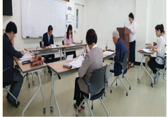
2분기 운영위원회 (5/17)