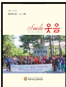
표지 : 자원봉사자 나들이