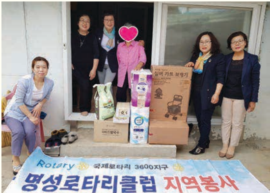
명성로타리클럽 지역봉사(5. 30)