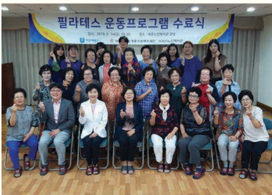
필라테스 운동프로그램 수료식(6. 14)