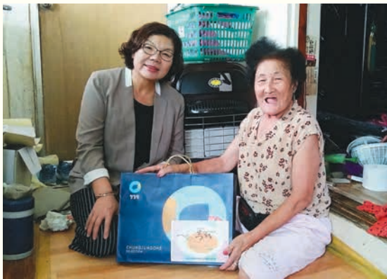
추석 명절 선물 전달 (9/5)