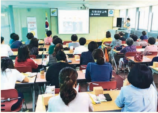
돌봄봉사자 보수교육(9. 5)