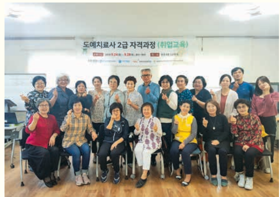
도예치료사 2급 자격과정 수료식(9. 28)