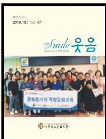
표지 : 사회공헌활동 기부은행 돌봄봉사자 역량강화교육