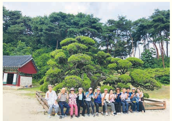
인지지원 외부활동 프로그램(8. 23)