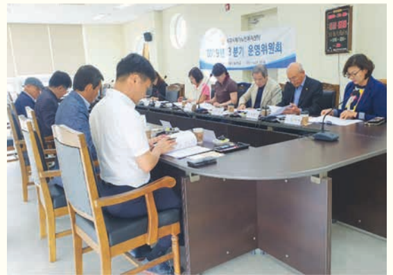
2019년 제3분기 합동 운영위원회 (9/20)