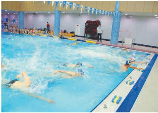
제1회 여주시노인복지관장배 수영대회(7. 6)