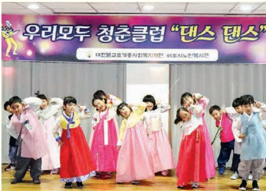
추석맞이 한가위 한마당(9. 10)