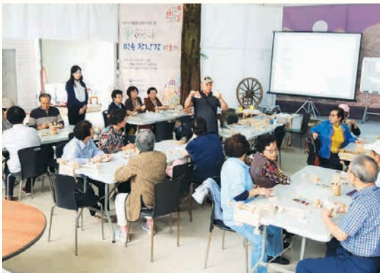
문화체험 야외수업(9. 25)