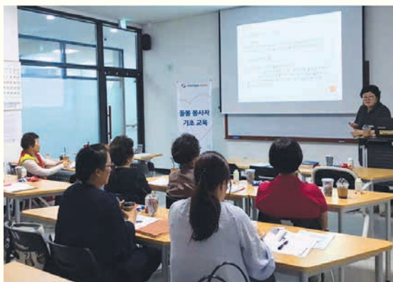
돌봄봉사자 기초교육(8. 29)