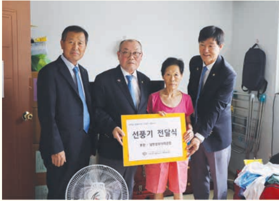
남한강로타리클럽 선봉기 후원 (7/12)