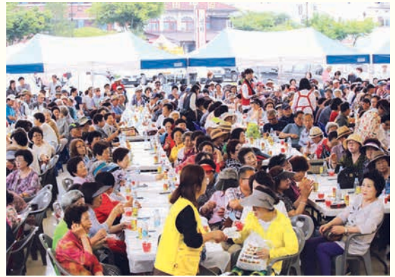
삼계탕으로 건강한 여름나기(7. 12)