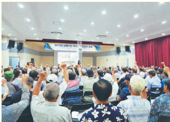
선배시민 리더십 역량강화교육(8. 2)