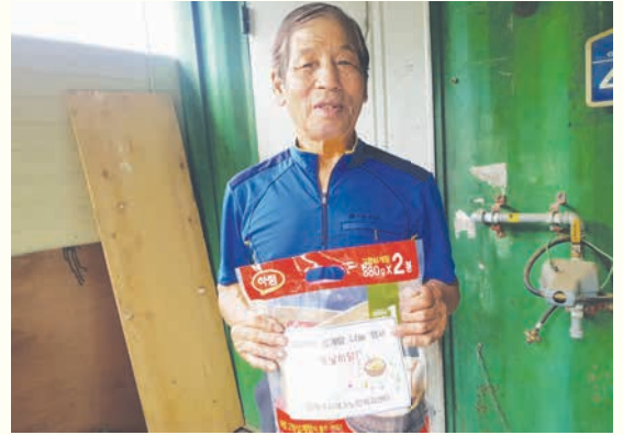
삼계탕지원사업 '복날이닭' (7/15)