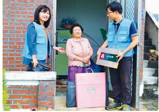
한강보관리단 한가위 온정나누기(9. 9)