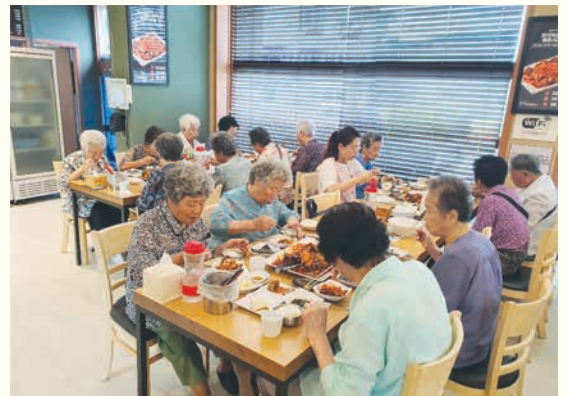
재가노인의 영양보충을 위한 외식지원사업 '외식하는 날' (8/28)