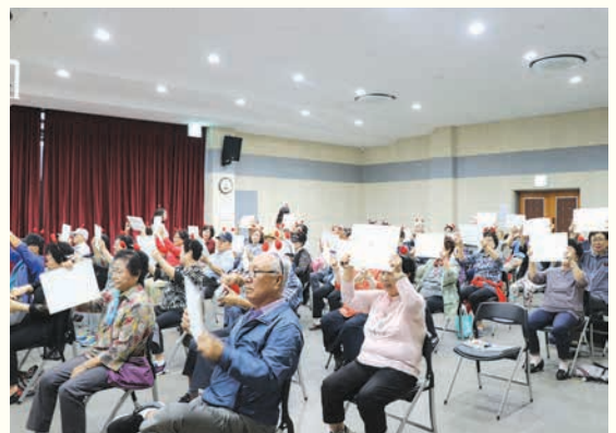
교통안전 베테랑교실 도전! 골든벨(9. 4)