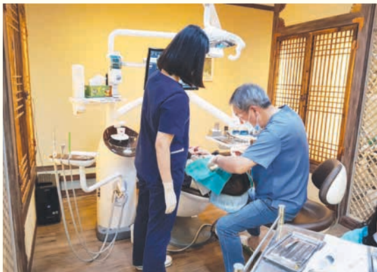
KCC 지정기탁 후원금 저소득 지역 주민 치과진료 연계 (8/19)