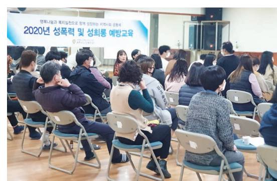
직원교육 - 성희롱 예방교육