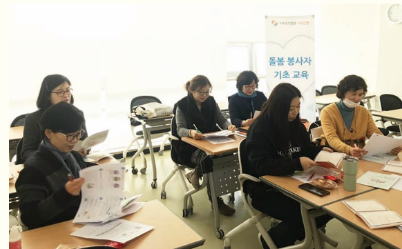
기부은행 돌봄봉사자 기초교육(2. 20)