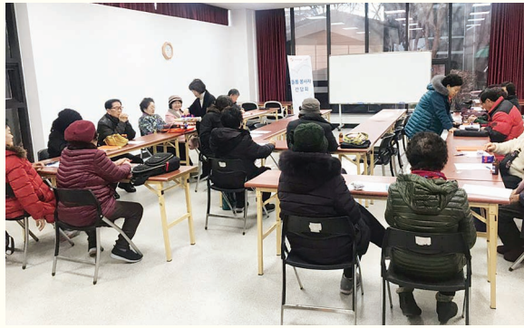
기부은행 1월 간담회(1. 14)