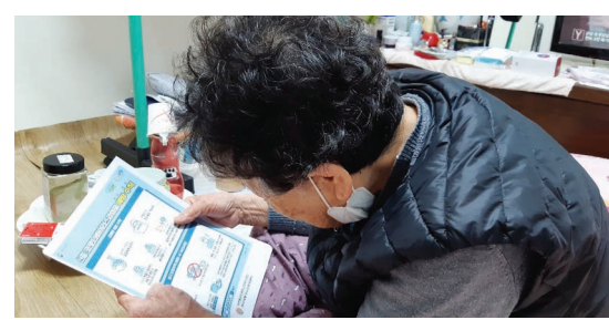
코로나19 바이러스 예방교육(1. 30)