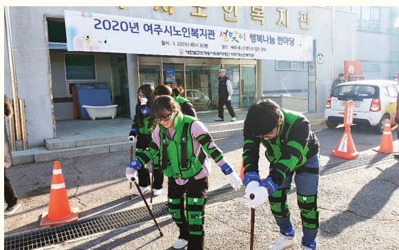
기부은행사업 노인체험활동(1. 28)