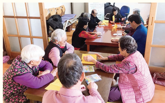
성인식개선사업 집단상담(2. 3)