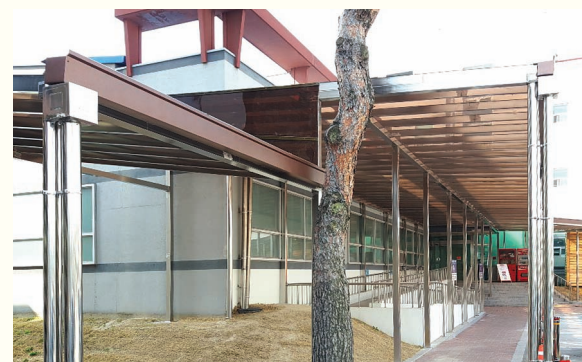
본관 - 별관 비가림막 설치(3. 13)