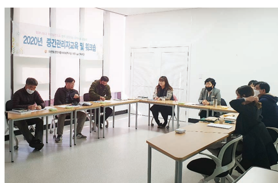
중간관리자교육 및 워크숍