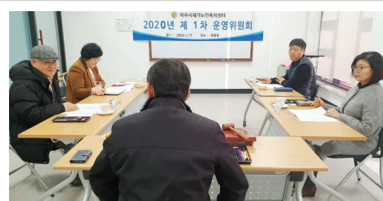
2020년 1차 운영위원회(1. 17)