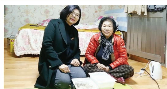
설맞이 '사랑의 떡만둣국' 나눔(1. 21)