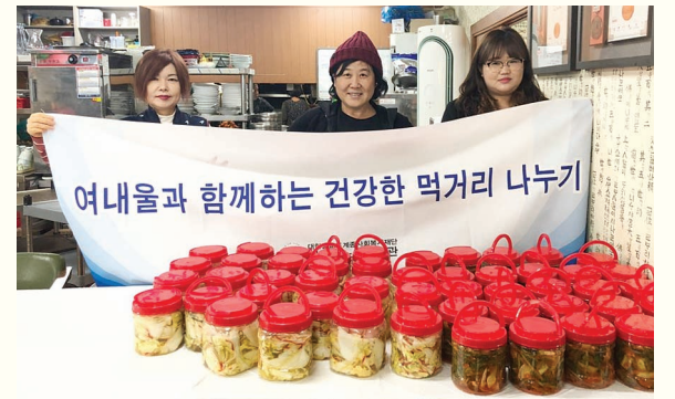
저소득어르신 김치 제공 - 여내울 후원(3. 9)