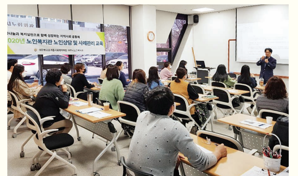
직원교육 - 사례관리(3. 24)