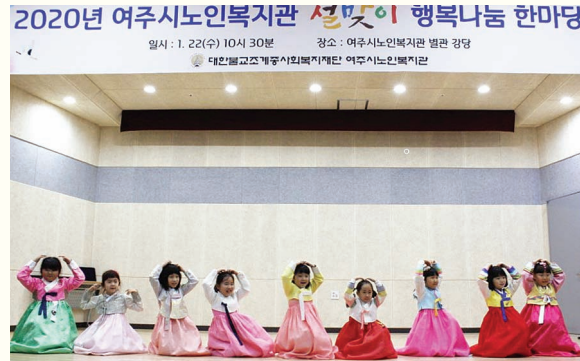
설맞이 행복나눔 한마당(1. 22)