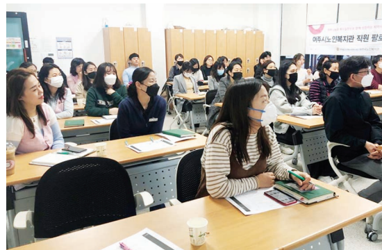
직원교육 - 팔로워십