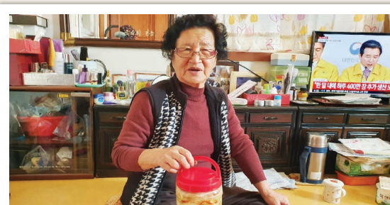
물김치 전달 - 여내울전통순두부 후원(3. 5)