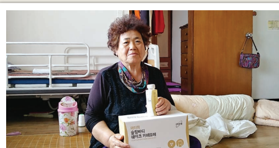
경기사회복지공동모금회와 함께하는 '실버건강라이프' 후원 쉐이크 전달(3. 12)