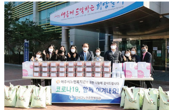
달서구노인복지관 후원물품 전달