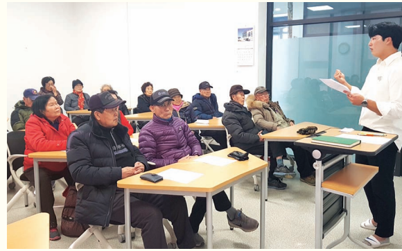
노인일자리/사회활동지원사업 간담회 (1. 17 ~ 1. 23)