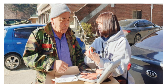
재난 인식 및 대비를 위한 안전생활보장 'LIFE CLOCK'(1. 21)