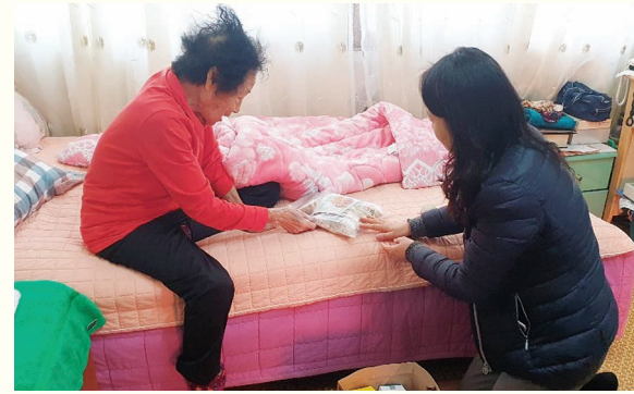
정월대보름 부럼나눔(2. 7)