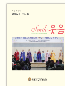
표지 : 설맞이 행복나눔 한마당

제호 웃음 제49호 | 발행일 2020년 4월 24일 | 발행처 여주시노인복지관 | 발행인 이석자 | 편집인 박은하 이봉열 주소 경기도 여주시 여흥로 160번길 27 | 전화 (031)881-0050 | 팩스 (031)881-0041 | 메일 yjsilver@yjsilver.or.kr 홈페이지 www.yjsilver.or.kr | 디자인 남한강종합인쇄 (031)886-7353