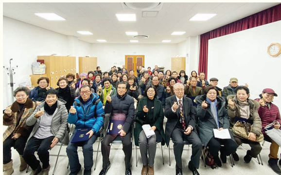
상반기 이용자 및 프로그램 반장간담회 (1. 21)