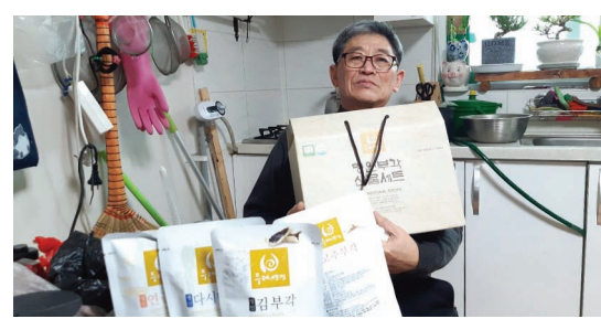
후원물품(김부각, 쌀) 전달(2. 21)