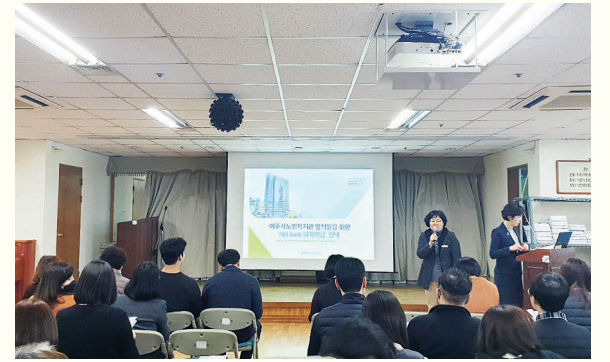
직원교육 - 퇴직연금(2. 12)