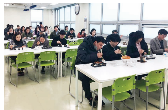
지역상권 살리기 - 배달음식 식사