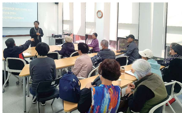
노인상담 '아름다운 삶과 마무리' 웰다잉 프로그램 (10.17~11.16)