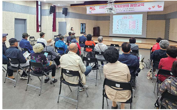
노인대상 성매개 감염병 예방교육 (10.11)