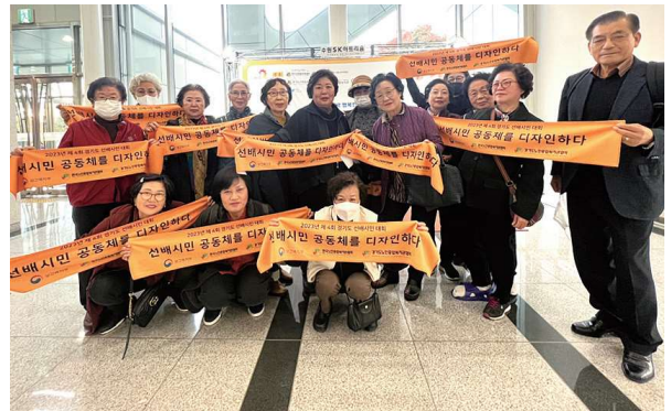
2023년 경기도 선배시니어 대회 (10.31)