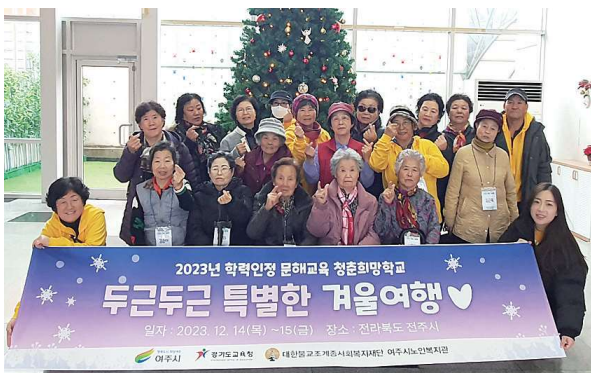
2023년 학력인정 문해교육 청춘희망학교 두근두근 특별한 겨울여행(12.14~12.15)