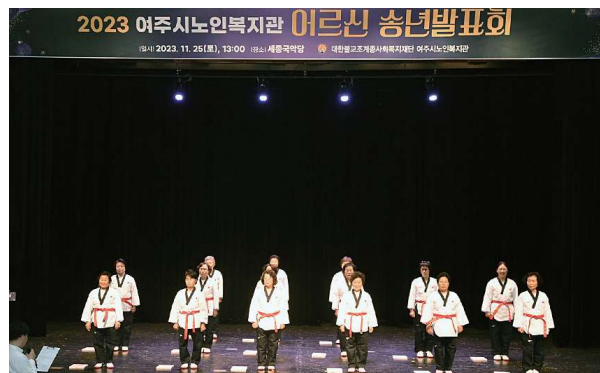
2023년 여주시노인복지관 어르신 송년발표회 (11.25)