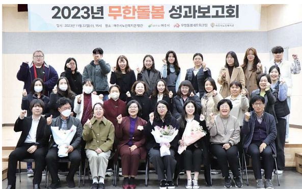
2023년 무한돌봄 성과보고회 (11.22)