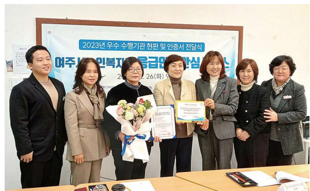
응급안전안심서비스 현판식 (12.26)