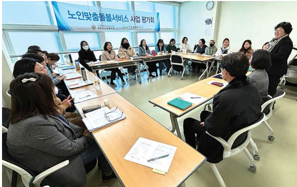
노인맞춤돌봄사업 하반기 사업평가회 (11.30)