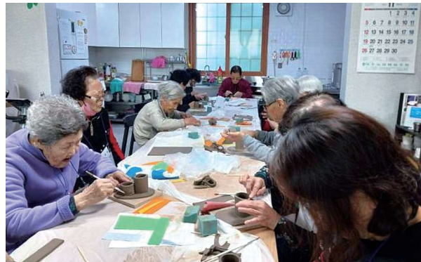
경로당활성화사업 특화프로그램 '삶을 빛다' (10.16~12.8)