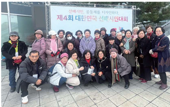
전국선배시민대회 참가 (12.5)