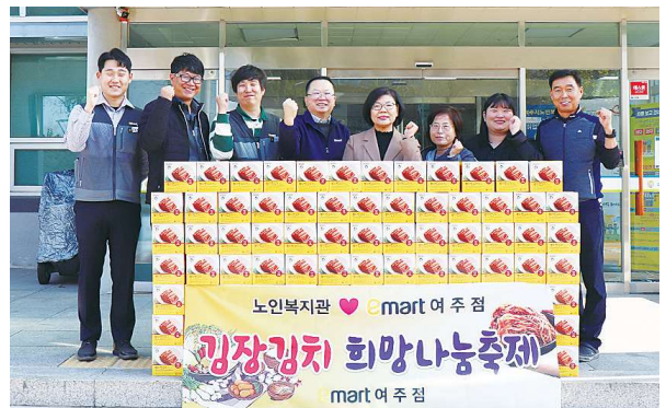
이마트 여주점과 함께하는 김장김치 희망나눔축제 (11.9)