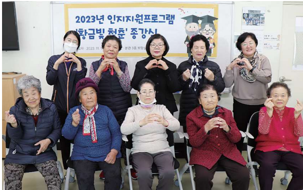
인지지원프로그램 '황금빛 청춘' 종강식 (11.14)