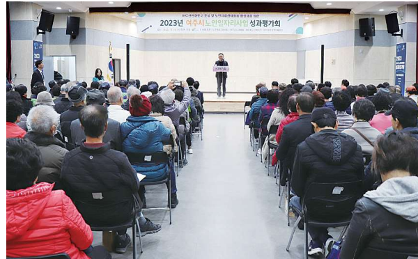
노인일자리 및 사회활동지원사업 종결평가회 (11.15)