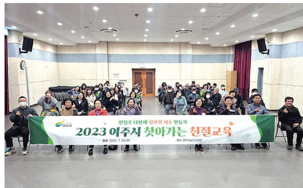
2023년 여주시 찾아가는 친절교육 (11.22)