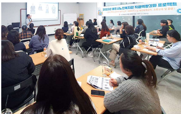
직원역량강화교육 '홍보 및 디지털역량강화' (10.17)