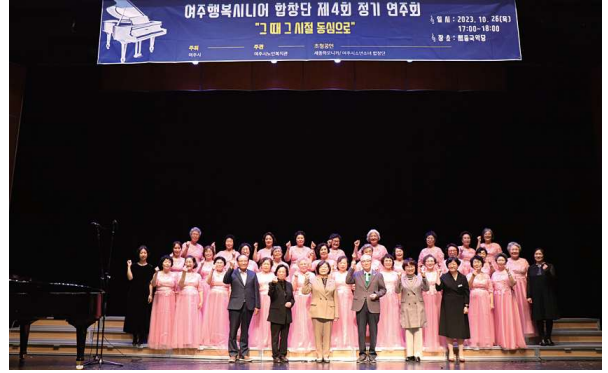
여주행복시니어 합창단 제4회 정기 연주회 '그때 그 시절 동심으로'(10.26)