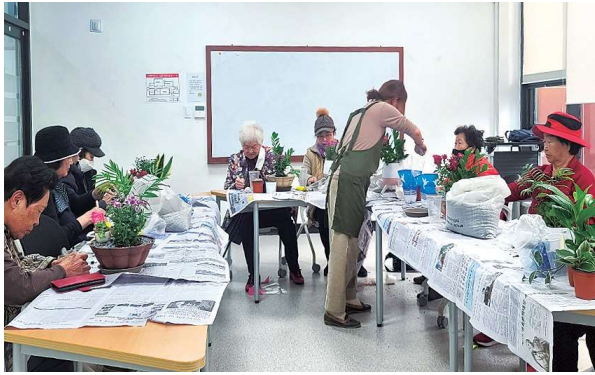
노인집단상담 '늘 봄' (10.5~11.16)