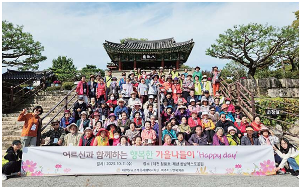
어르신과 함께하는 행복한 가을나들이 'HAPPY DAY' (10.11)