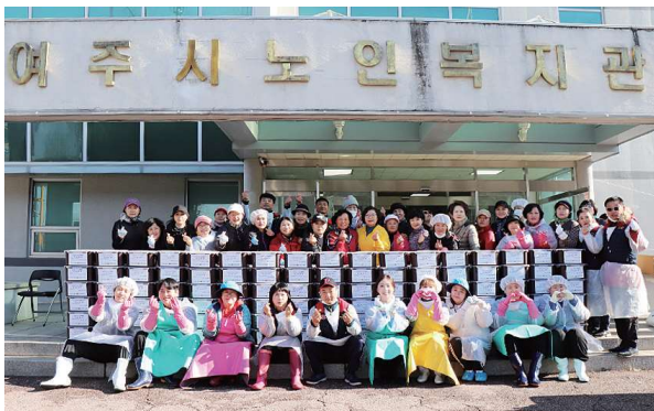
2023년 여주시노인복지관 자비나눔 김장축제 (11.16~11.17)