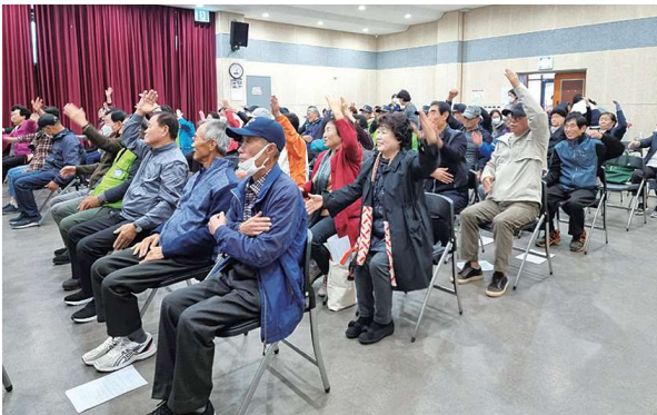
4분기 건강강좌 '허리 건강법' (10.27)