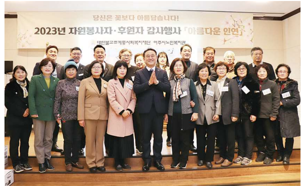
2023년 자원봉사자·후원자 감사행사 '아름다운 인연' (12.1)