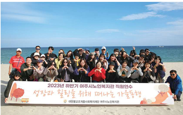
2023년 하반기 직원연수 (11.2~11.3)