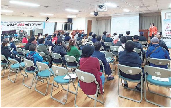
건강강좌 '갑작스러운 뇌졸중, 어떻게 대처할까요?' (10.20)