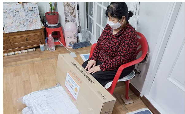
노인맞춤돌봄서비스 SK하이닉스와 함께한 '2023년 흑한기 이불·매트 지원사업'(12.7)