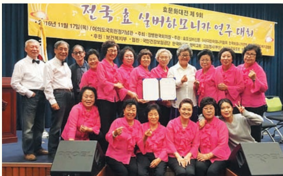
'세종하모니카' 전국 효 실버하모니카 연주대회 장려상 수상(11/17) / 국회 헌정기념관