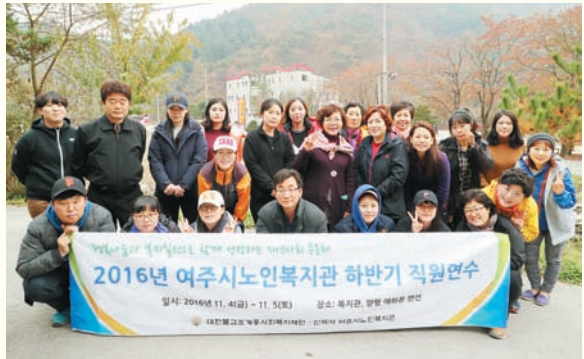
2016 하반기 직원연수(11/4~11/5) 복지관, 양평 애화몽