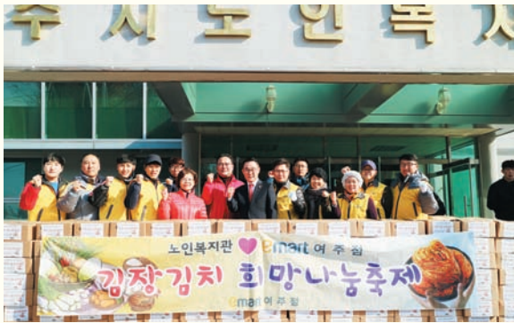
2016 자비나눔 김장축제(11/24~11/25) 복지관 정문