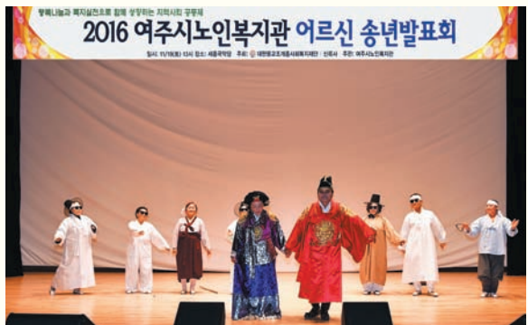
어르신 송년발표회(11/19) 세종국악당