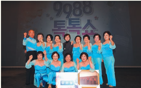
9988 톡톡쇼 본선 '라인댄스 동아리' 우수상 수상(10/27) / 고양시 어울림누리극장