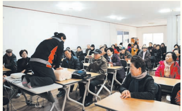
직원, 이용자 응급안전, 화재예방 교육 및 훈련(12/7) 복지관