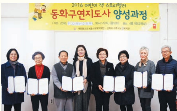
실버인력뱅크 동화구연동아리 수료식(12/8) 복지관 4층 3교육실