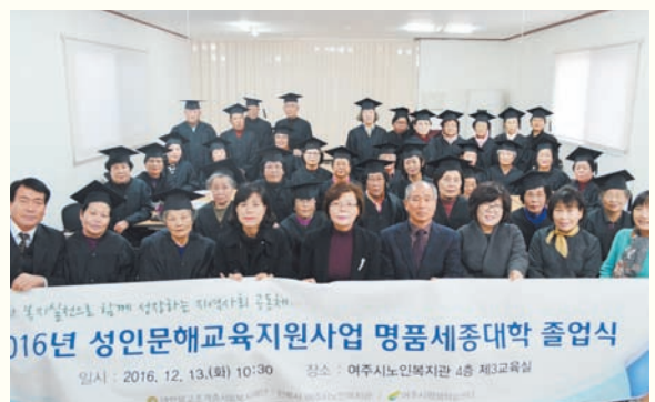
성인문해교육지원사업 명품세종대학수료식(12/13) 복지관 4층3교육실