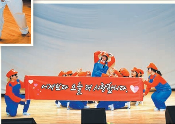
사진설명 : 2016 송년발표회(11.19.토)