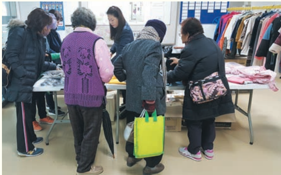
재가노인지원센터 미니바자회(12/7) 복지관 1층 로비