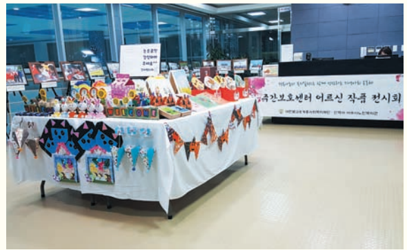
주간보호센터 작품전시회(12/6~12/9) 복지관 수영장 로비