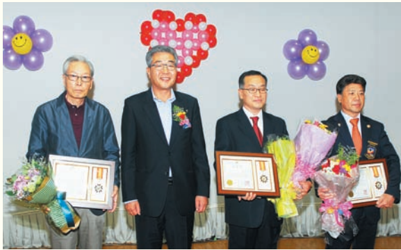
노인의 날 행사 실버기자단 공로상 수상(10/6) 여주시민회관