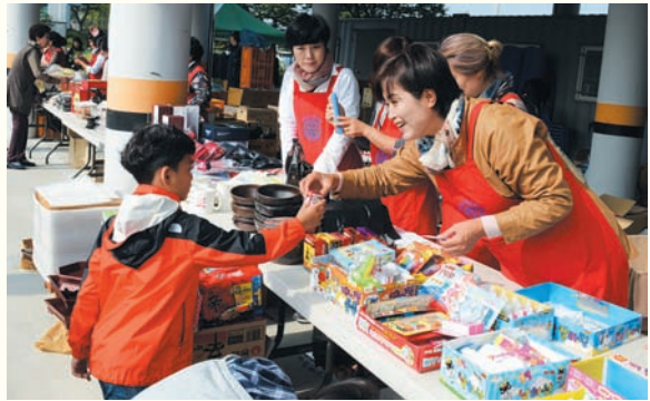
2016 지역나눔문화축제(10/12) 복지관 주차장